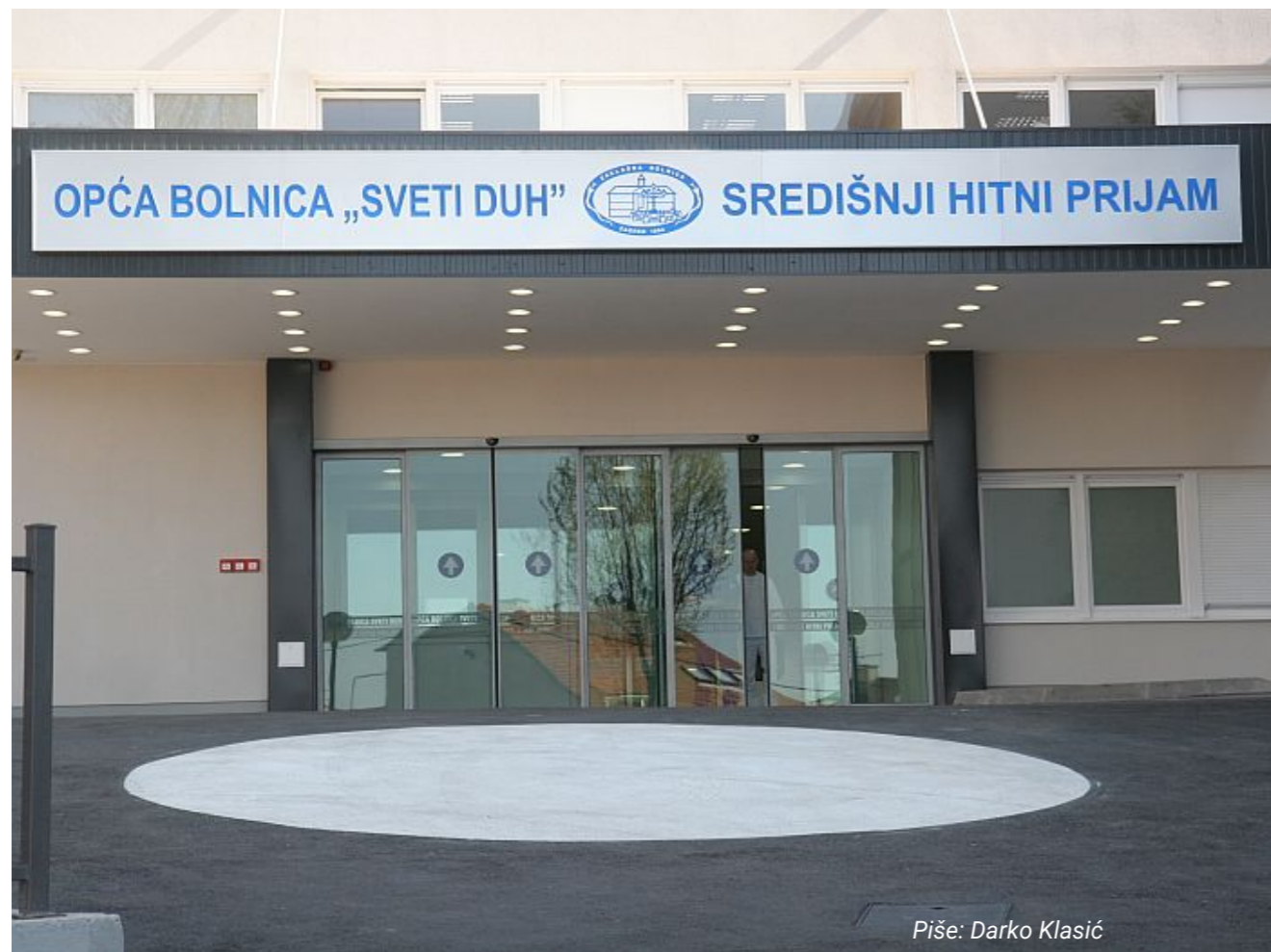
Piše: Darko Klasić

u inozemstvo, ali se nisu odrekli hrvatske zdravstvene iskaznice i uredno koriste zdravstvene usluge u Hrvatskoj. Znan dio njih radije posjeti doktora ili stomatologa u Hrvatskoj jer im je to daleko povoljnije nego platiti istu uslugu u državi u kojoj trenutno žive. Prema nekim procjenama tako povremeno koriste zdravstveno osiguranje dvije trećine naših građana koji su otišli iz Hrvatske. Većina EU zemalja ima obvezu automatskog osiguranja radnika prilikom njihova zapošljavanja, zbog čega postoji velik broj ljudi koji rade u inozemstvu, ali kojima je unatoč inozemnom zdravstvenom osiguranju povoljnije doći u Hrvatsku jer u stranoj zemlji često imaju uplaćenu minimalnu košaricu osiguranja koja ne obuhvaća sve usluge koje mogu besplatno dobiti u Hrvatskoj. Nemojte misliti da je riječ o neznatnim sredstvima jer na temelju grube računica