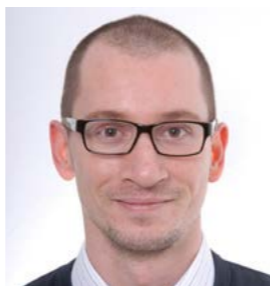
Piše: Sandro Salopek

Zbog institucionalne i vrijednosne krize povezane s postupanjem prema izbjeglicama treba tražiti raspravu unutar Odbora za nacionalnu sigurnost