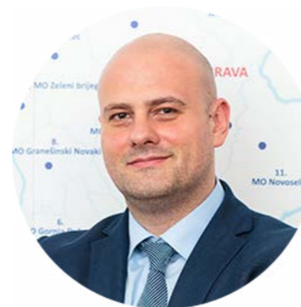
Piše: Daniel Hinš

Model novog javnog menadžmenta sadrži javne politike za tržišno usmjerene institucionalne reforme. Zemlje koje su primijenile ovaj model općenito su među prvih dvadeset na globalnim ljestvicama vezanima uz ljudski razvoj, ljudsku slobodu, ekonomsku slobodu, lakoću poslovanja, deregulaciju tržišta, konkurentnost, antikorupcijsku transparentnost i liberalnu demokraciju. Dok su nordijske zemlje uvele vanjsko ugovaranje usluga (outsourcing) i tržišno natjecanje unutar svojih sustava države blagostanja, a Njemačka se snažno usmjerila na privatizacije, anglosaksonske zemlje, a posebice Sjedinjene Države, ugovaraju čak i dijelove nacionalne sigurnosti s privatnim vojnim i obavještajnim pružateljima. Međutim, model novog javnog menadžmenta ne zanemaruje ulogu države, već potiče njezino smanjivanje i otvaranje za