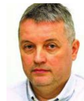
Piše: Mario Galić

Još od doba pračovjeka plemena su se osnivala prije svega kako bi pojedincima unutar njih osigurala sigurnost, zaštitu teritorija i olakšala lov. Nagoni su ga navodili da osniva sve veće zajednice koje će sigurnost svakodnevnog života podići na viši nivo. Plemena su s vremenom prerasla u naseobine i sela, pa potom gradove. Već su najranija sela i gradovi dobivali sustave obrane, prije svega u vidu obrambenih rovova, drvenih ograda i naposljetku kamenih zidina.